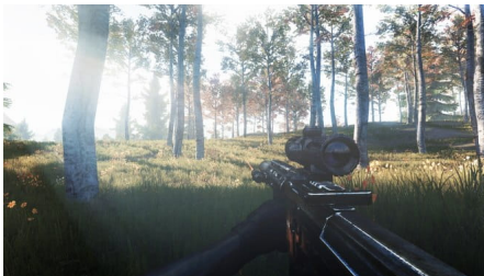
Infestation: The New Z

Na graczy czekają duże, otwarte światy i serwery skupiające się na walce z komputerowym przeciwnikiem lub wręcz przeciwnie – na rywalizacji użytkowników. Jest też specjalny tryb Battle Royale, w którym wygrywa osoba, która jako ostatnia pozostanie przy życiu.