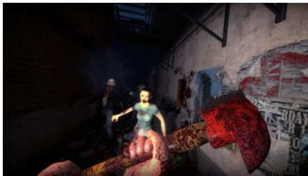
No More Room in Hell

No More Room in Hell przypadnie do gustu wszystkim tym, którzy dobrze bawili się przy Left 4 Dead lub Killing Floor.